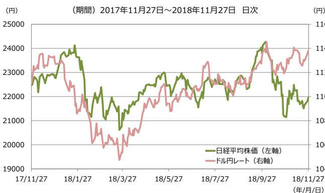
(図表1) 日経平均株価とドル円レートの推移

国内株式市場は、期首から1月下旬にかけては、世界的な景気拡大や良好な国内企業業績、米国の法人税減税施行などが好感され上昇しました。しかし、米国の利上げペースの加速懸念や通商政策に対する不透明感などを背景に、3月下旬にかけて下落しました。その後は、米中貿易摩擦への警戒や国内企業の業績拡大に対する期待などが交錯し、一進一退の展開となりました。期末にかけては、米中貿易摩擦の激化を背景とした世界的な景気減速や先行きの企業業績への警戒感の高まりなどを受けて、投資家のリスク回避姿勢が強まり、国内株式市場は大幅に下落しました(図表1)。