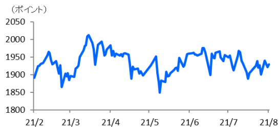
（図表1）TOPIX（東証株価指数）の推移

(期間) 2021年2月5日～2021年8月5日 日次 (年/月)