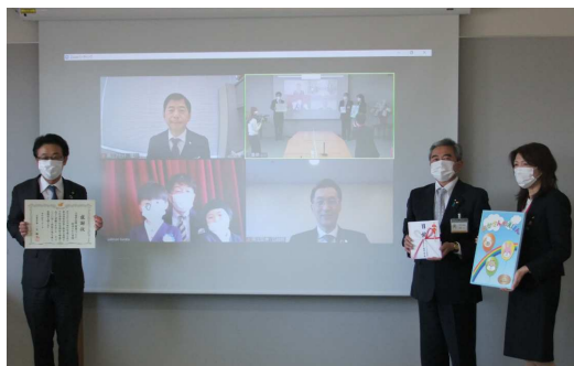
三重県庁にてオンラインも併用し贈呈式を実施 (2022年2月1日)

今回の寄附も加えて、ファンド設定来で 総額1億4,928万3,730円分、13万3,375冊の絵本を三重県下の保育園等に寄附 させていただいております。