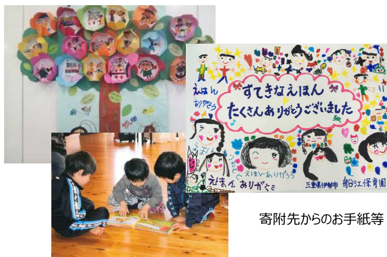
寄附先からのお手紙等