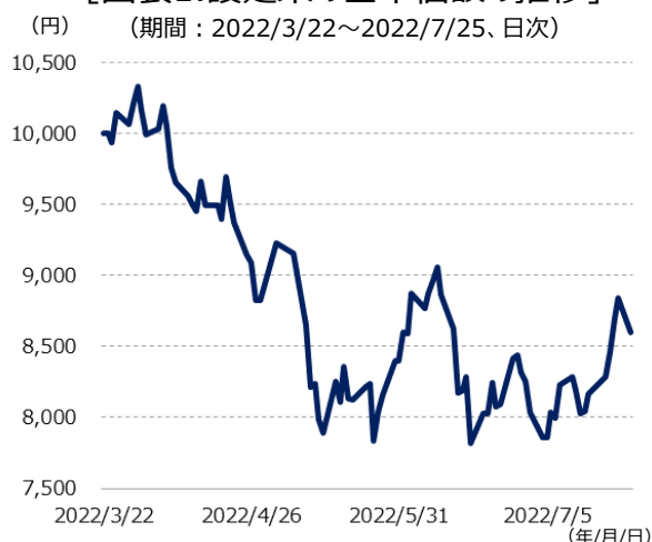
[図表1. 設定来の基準価額の推移] (期間：2022/3/22～2022/7/25、日次)

※基準価額は1万口当たり、信託報酬控除後です。 ※グラフは過去の実績であり、将来の成果を示唆又は保証するものではありません。