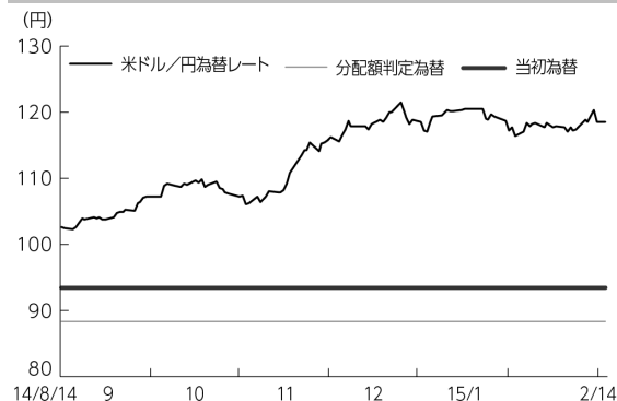
米ドル/円為替レートの推移

当ファンドは特定のベンチマークを設けておりませんが、分配金を考慮した基準価額の騰落率は、参考為替としている米ドル/円為替レートの騰落率を下回りました。